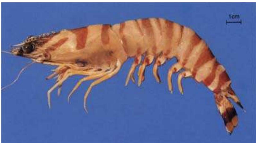
กุ้งหัวมัน หลังไข่