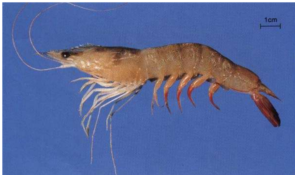
กุ้งหัวมัน, หลังไข่