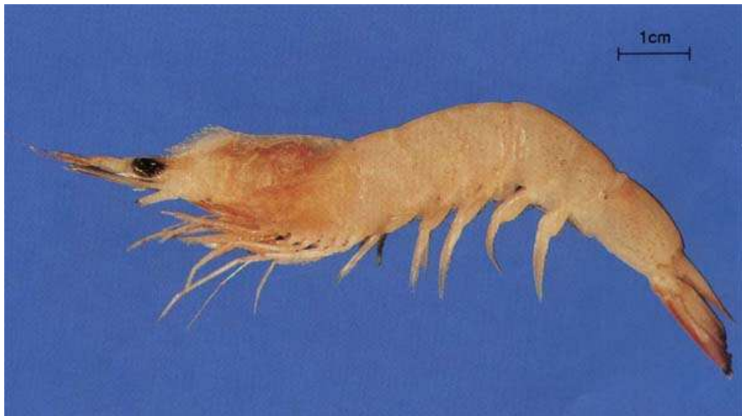
กุ้งแก้ว