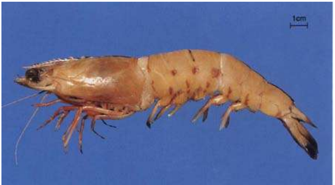
กุ้งเหลือง กุ้งหางฟ้า