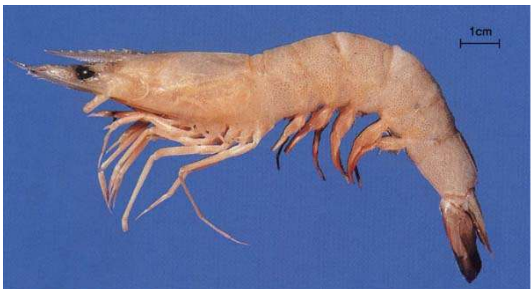
กุ้งตะกาดตัวใหญ่