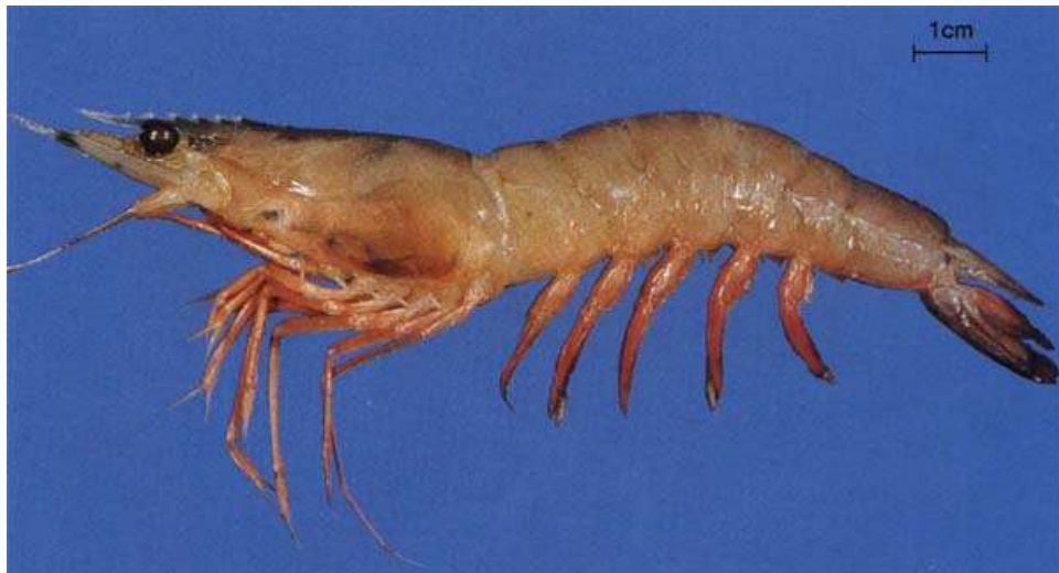
กุ้งตะกาดตัวใหญ่