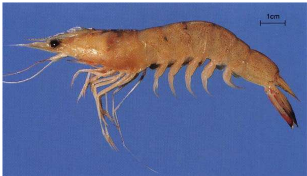
กุ้งหัวมัน หลังไข่