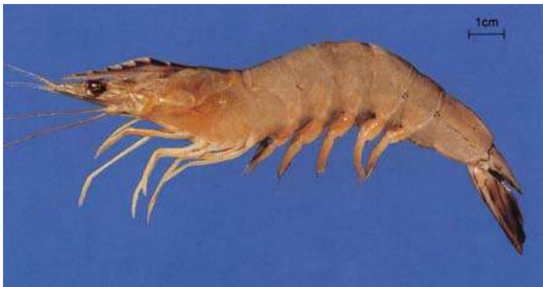
กุ้งแชบ๊วย กุ้งหางแดง กุ้งขาว