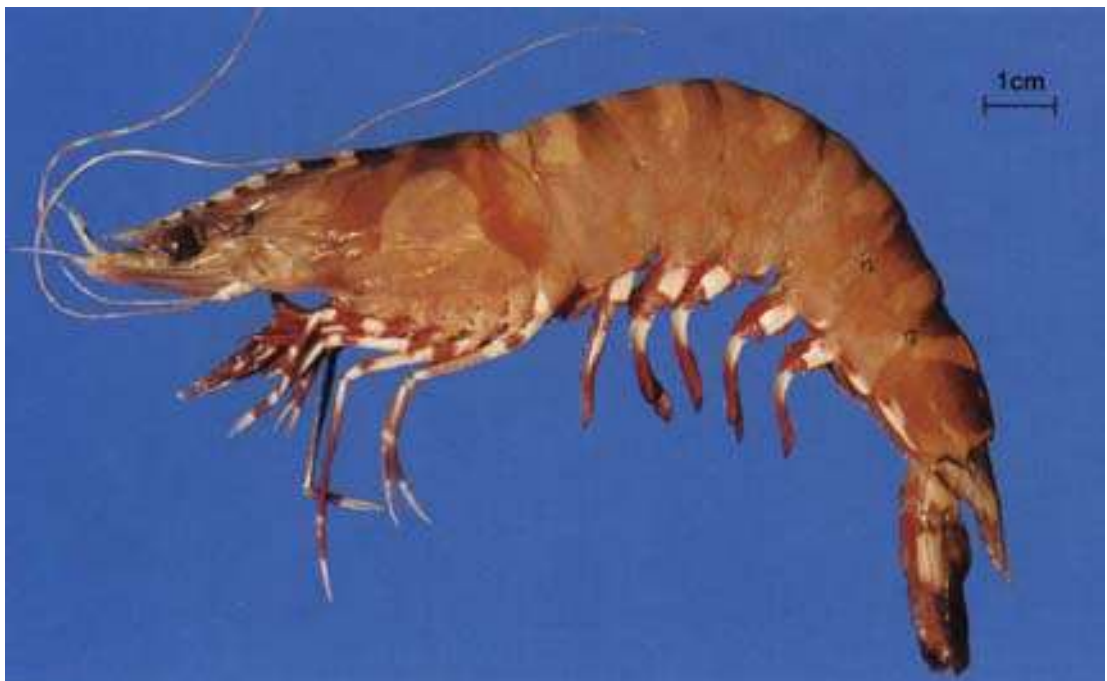
กุ้งกุลาลาย